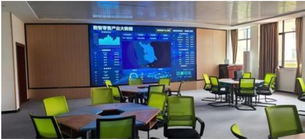
图 智慧 售 中心