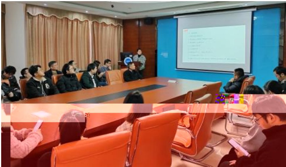
图 员工专业技 培