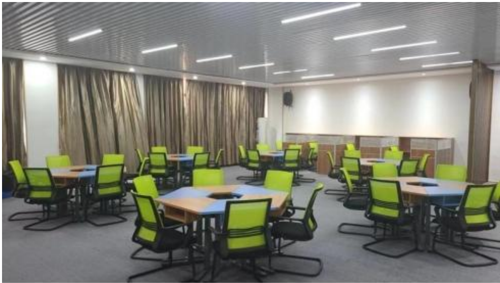
图 智慧 售 中心