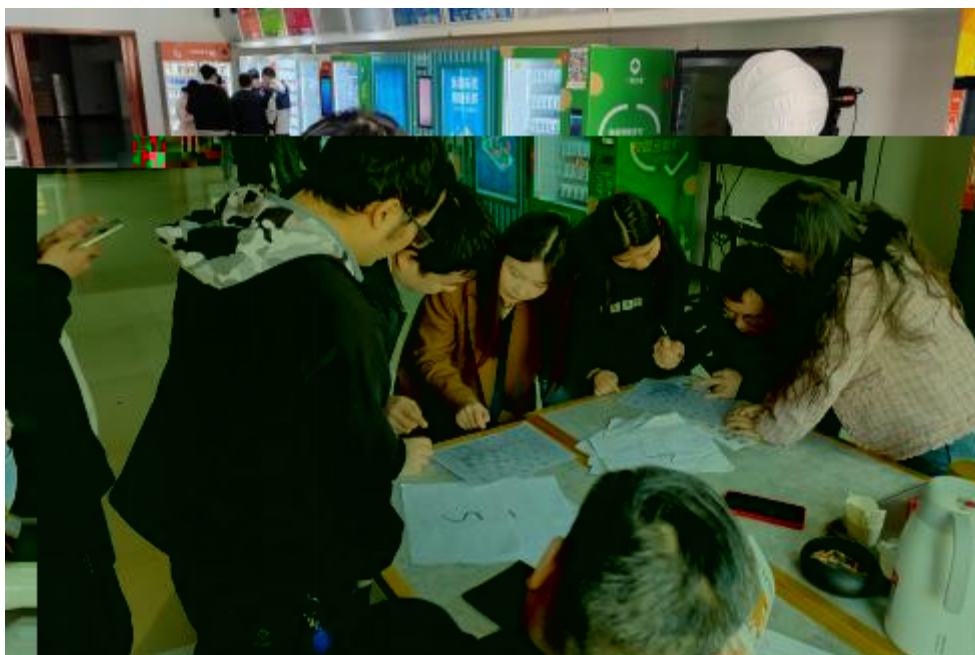
图 卓 团 建 共