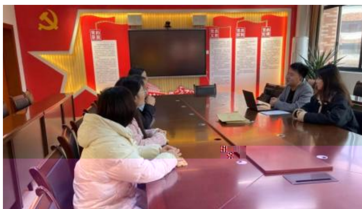
图 2-1 企开展学术 交 会